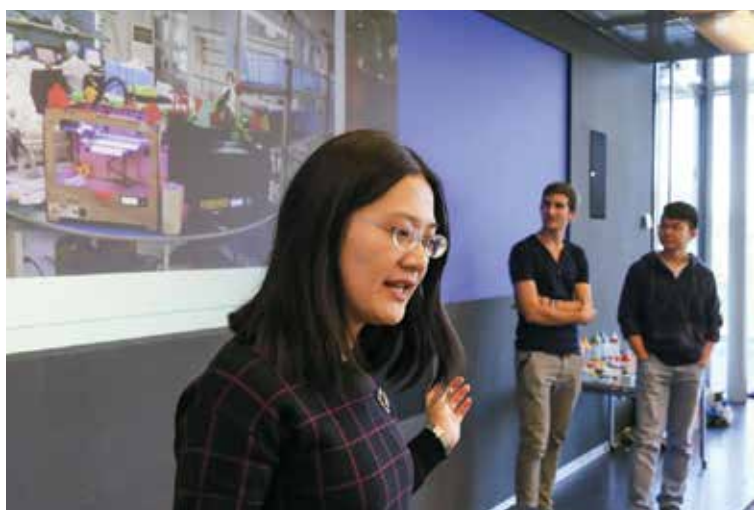
Groupes d'étudiants ayant participé au China Hardware Innovation Camp (CHIC), un projet durant lequel des étudiants de l'EPFL, de HEC et de l'ECAL conçoivent un produit puis se rendent en Chine pour le faire fabriquer.