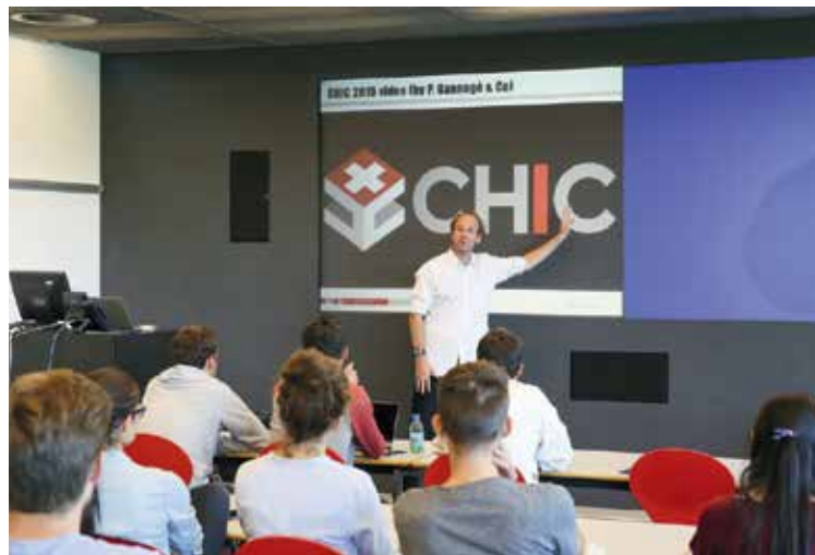
Marc Laperrouza, responsable du programme.